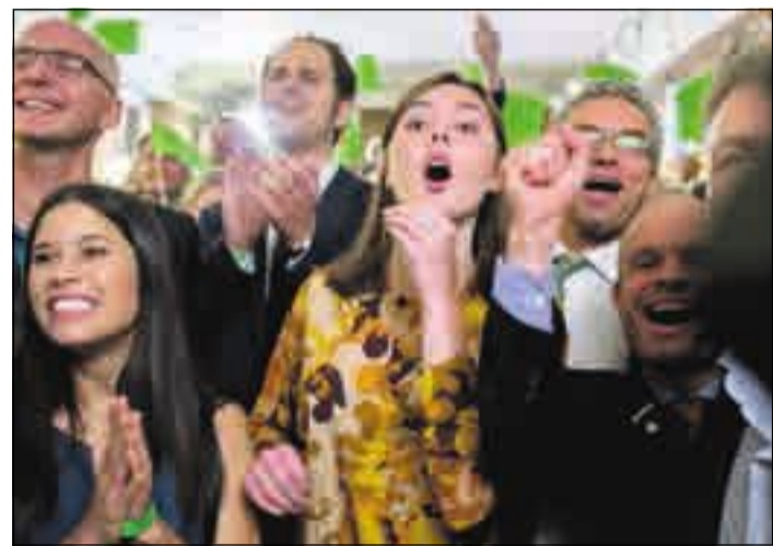
STIGER FRAM: MDG tenker helhetlig og nytt, skriver forfatteren. Her fra valgkvaken i 2015.